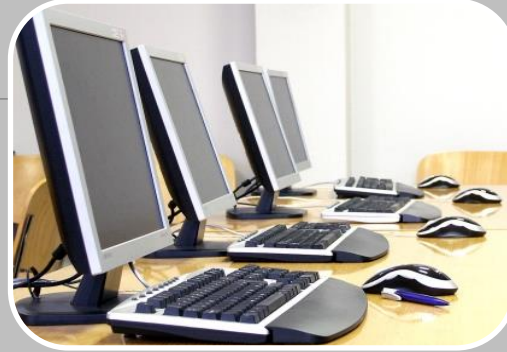
3 αίθουσες υπολογιστών