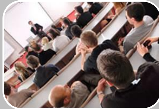
2 αίθουσες διαλέξεων