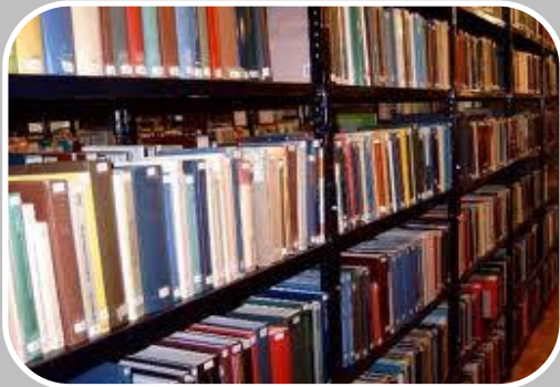
δανειστική βιβλιοθήκη και αναγνωστήριο